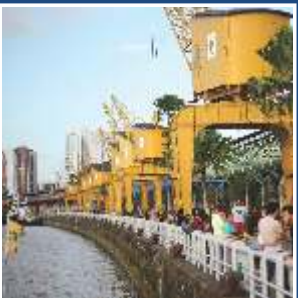
Estação das Docas