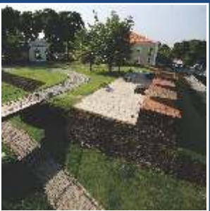
Complexo Feliz Lusitânia