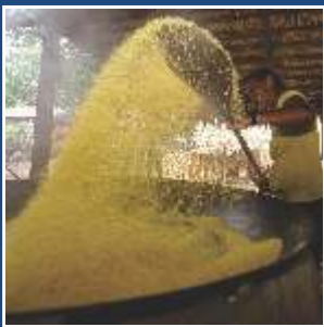
Produção de farinha de mandioca